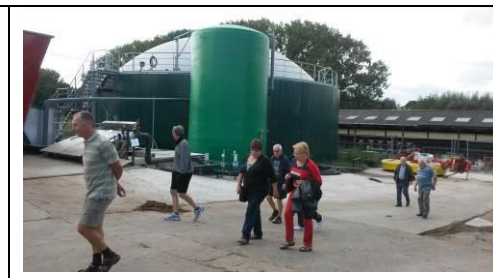
De vergister op de achtergrond