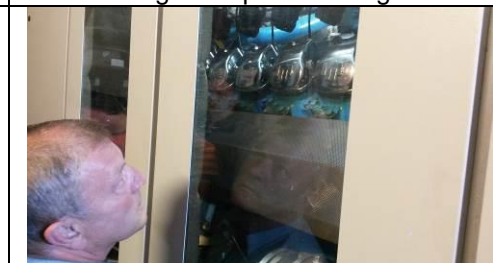
De 12 cilinder motor