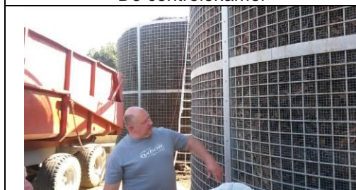
De biofilters voor gaszuivering