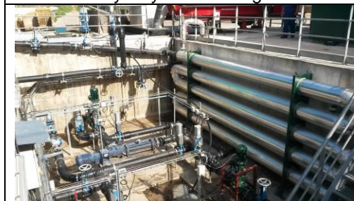
Warmtewisselaar en pompen