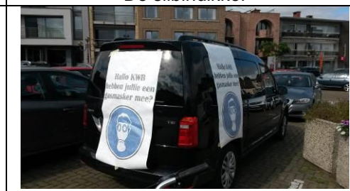
Pamfletten bij het afspraakpunt op Markt